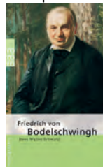
Buchcover: rororo Biografie von Hans-Walter Schmuhl