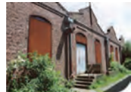
Gemeindehaus Düren-Ost