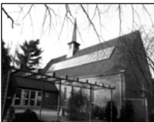
Gemeindezentrum Christuskirche Frelenberg Theodor-Seipp-Str. 5