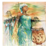
Foto: (In gratitude to mother Earth / In Dankbarkeit an Mutter Erde)"Sri Irodikromo, © Weltgebetstag der Frauen Deutsches Komitee