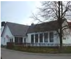
Geusenhaus Bocket, An der Flachsroth 4 Waldfeucht