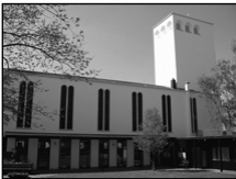
Gemeindezentrum Erlöserkirche Übach Maastrichter Str. 49

Die Veranstaltungen finden in den drei Gemeindezentren der Evangelischen Kirchengemeinde Übach-Palenberg statt: