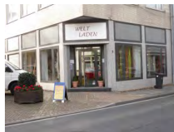
Weltladen Gangelt Sittarder Str. 5, Gangelt