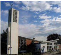
Friedenskirche Gangelt, Lohausstraße 36

Die Veranstaltungen finden in den zwei Gemeindezentren der Evangelischen Kirchengemeinde Gangelt, Selfkant, Waldfeucht statt: