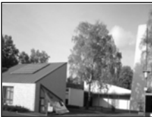
Gemeindezentrum „Hütte“ Marienberg Schulstr. 46