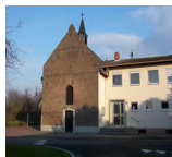
Gemeindehaus in Teveren, Welschendriesch 3