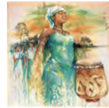
Foto: (In gratitude to mother Earth / In Dankbarkeit an Mutter Erde) Sri Irodikromo, © Weltgebetstag der Frauen Deutsches Komitee

Weltgebetstag Einladung zum Gottesdienst in der Katholischen Kirche Frelenberg Freitag Referentinnen: Team kath. Frauengemeinschaft und ev. Frauenhilfe 02. März 2018 14.30 Uhr