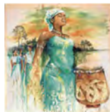
Foto: (In gratitude to mother Earth / In Dankbarkeit an Mutter Erde) - Sri Irodikromo, © Weltgebetstag der Frauen Deutsches Komitee