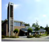
Evangelisches Gemeindezentrum Inden/Altdorf