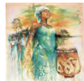
Foto: "Gran tangi gi Mama Aisa (In gratitude to mother Earth)", Sri Irodikromo