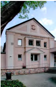
Martin-Luther-Haus, Moltkestr. 3

Die Veranstaltungen finden in folgenden Gebäuden der Evangelischen Kirchengemeinde Eschweiler statt: