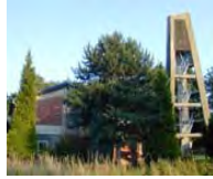
Ev. Gemeindezentrum Langerwehe