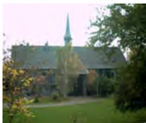
Evangelisches Gemeindezentrum Weisweiler, Burgweg 7, Weisweiler

Die Veranstaltungen finden in den zwei Gemeindezentren der Evangelischen Kirchengemeinde Weisweiler-Dürwiß statt.