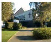
Ev. Gemeindezentrum Dürwiß