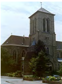
St. Barbara, Friedrichstraße 7