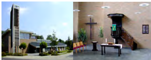
Evangelisches Gemeindezentrum Inden/Altdorf, Auf dem Driesch 1-3

Die Veranstaltungen finden in den zwei Gemeindezentren der Evangelischen Kirchengemeinde Inden-Langerwehe statt: