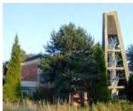
Evangelisches Gemeindezentrum Langerwehe, Josef-Schwarz-Straße 21