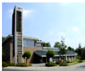
Evangelisches Gemeindezentrum Inden/Altdorf