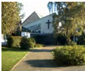
Evangelisches Gemeindezentrum Dürwiß Konrad-Adenauer-Straße 35, Dürwiß