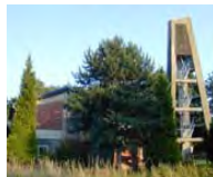
Ev. Gemeindezentrum Langerwehe

montags ab 04. September 2017 9.00 - 11.15 Uhr 9 x